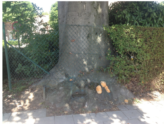
, 25 Juillet 2013