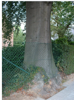
, 08 Septembre 2003

XLSX (Excel 2007) - XLS (Excel 1997-2003) .