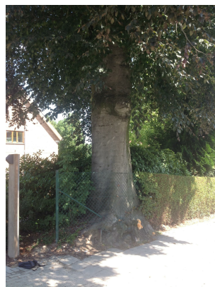
, 25 Juillet 2013