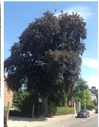
, 25 Juillet 2013